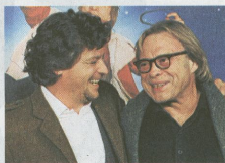
Schauspieler Fritz Karl (l.), Musiker Volker Lechtenbrink

In ihrem neuen Kinofilm „Als der Weihnachtsmann vom Himmel fiel“ spielt Schauspielerin Jessica Schwarz die Besitzerin eines Schokoladenladens. „Das war herrlich! Weil ich alle Pralinen durchprobieren durfte“, sagte Schwarz bei der Kinopremiere im Mathäser. Die Constantin-Verfilmung von Cornelia Funkes Bestseller gefiel dem Premierenpublikum ausgesprochen gut.