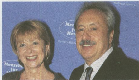
Schauspielerin Ursela Monn mit Kollege Wolfgang Stumph