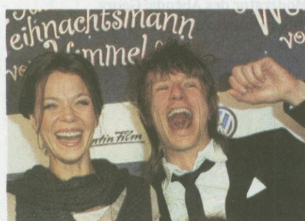
Schauspielerin Jessica Schwarz mit Kollege Alexander Scheer